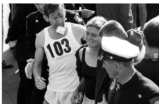
Bobbi Gibb 1966an, helmugara iritsitakoan.

Baina era batera edo bestera, bi neskek argi utzi zuten gai zirela maratoia bukatzeko, emakumeak gai zirela. Beraz, 1972an , Bostongo maratoni-antolatzaileek hainbat erabaki hartu zituzten. Adibidez, emakumeak onartzea, aitortzea Bobbi Gibb izan zela Bostongo maratoia bukatu duen lehen emakumea, eta baita 1966, 1967 eta 1968ko emakumerik azkarrena ere.